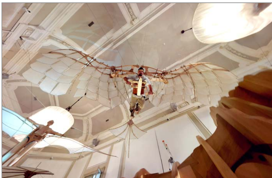
◀ Aquila Meccanica Il modello in mostra