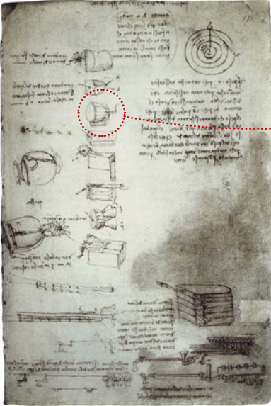
▲ Tamburo elastico Codice Arundel, foglio 175r