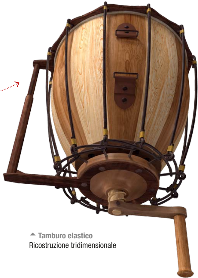
▲ Tamburo elastico Ricostruzione tridimensionale