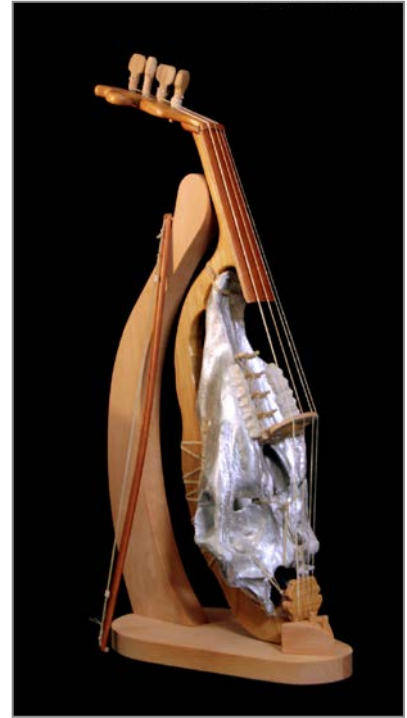
▲ Lira d'argento Modello da braccio a quattro corde