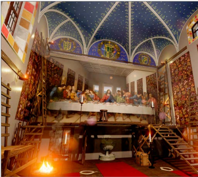
◀ Ultima Cena Esperienza virtuale