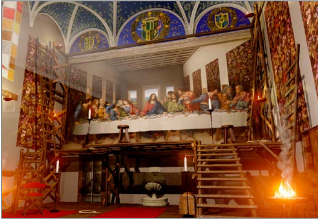
◀ Ultima Cena Esperienza virtuale