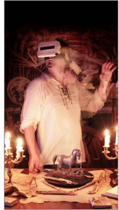
▲ Ultima Cena Esperienza virtuale