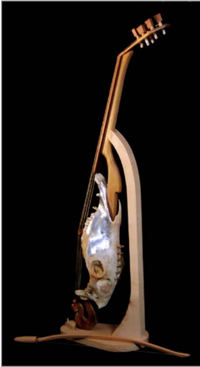
▲ Lira d'argento Modello da gamba a cinque corde