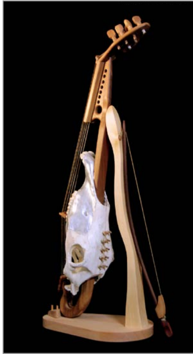
▲ Lira d'argento Modello da braccio a sei corde